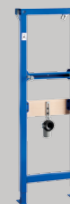
WISA XS WT-Element mit Einbausiphon Art.Nr. 8050.452723