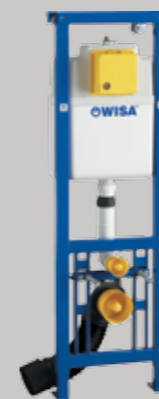
WISA XS WC-Element Vario Art.Nr. 8050.452735

Während der Entwicklung dieser Produkte hatte WISA die Unterstützung eines breiten Installateurforums. Die Praxiserfahrung dieser Experten lehrt, dass Gesichtspunkte wie leichte Installation, Zuverlässigkeit und Reduzierung von Montagefehlern, aber auch eine gute Verarbeitung und Ästhetik eine wichtige Rolle spielen. Dieses Wissen, kombiniert mit der jahrelangen Erfahrung, die WISA auf dem Gebiet der Spülsysteme hat, war die Grundlage für die Entwicklung von Produkten für der Gesundheits- und Altenpflege.