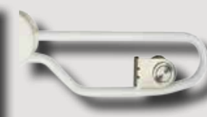
Solo SF für Stützgriffe 8050.404401