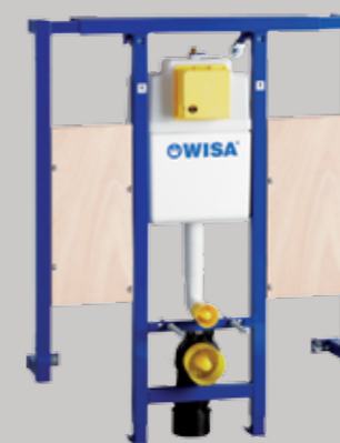
WISA XS L WC-Element mit Halteplatten Art.Nr. 8050.452737