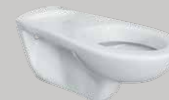
WISA Medica Wand-WC Art.Nr. 9100.901946