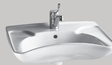
WISA Medica Waschtisch Art.Nr. 9100.901930