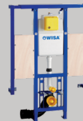
WISA XS L WC-Element Vario mit Halteplatten Art.Nr. 8050.452738