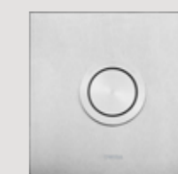
Luga Steel 8050.404001

Die Bedienungsplatten sind so ausgelegt, dass sie alle Annehmlichkeiten bieten. So kann die Bedienungstaste Solo Steel inkl. pneumatischer Hubeinheit mit oder ohne der Bedienungstaste Solo Steel verwendet werden. Die Bedienungstaste Solo Steel lässt sich auch mit der Bedienungsplatte Luga Steel kombinieren. Diese pneumatische Bedienungstaste Solo Steel aus Edelstahl lässt sich beispielsweise in einen Stützbügel integrieren als zusätzliche Fernauslösung. Außer den pneumatischen Bedienungsplatten können Sie auch die antibakterielle Bedienungsplatte Argos Antibac wählen. In dem Kunststoff sind Silberionen eingearbeitet, die für eine lang anhaltende antibakterielle Wirkung sorgen. Es wurde also nicht nur an Annehmlichkeiten gedacht, sondern auch an das Material und das Design, die Ihrem Badezimmer ein stilvolles Ambiente verleihen.